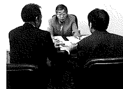
今監事による監査