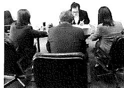
代見監事による監査

監査の結果、「事務全般 について適正かつ正確に 処理されていることを認 める」との講評をいただ きました。