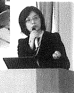
平澤先生による講演▶