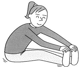
(足助式医療体操より)