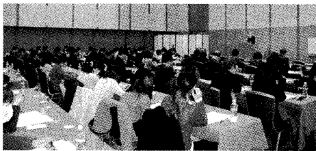
多勢の方に集まっていたきました。