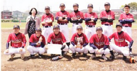
3位 日本エム・ケー・エス(株) 4位 (株)タニタ