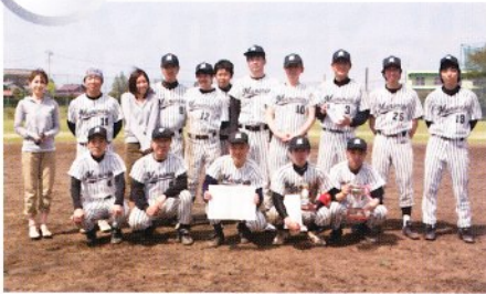
3位 エムティティ(株)